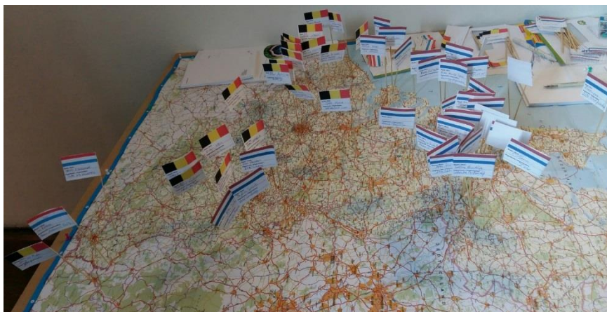
Carte Benelux montrant l'origine des participants de la Conférence.

La seconde conférence Benelux de cette trilogie avait pour titre « Apprendre à vivre dans les limites de notre planète » et s'est tenue du 22 au 24 novembre 2017 aux Pays-Bas, dans la province de Zélande à Walcheren. Lors de cette conférence, les cinq régions du Benelux, à savoir la Belgique (Flandre, Bruxelles, Wallonie), les Pays-Bas et le Luxembourg ont travaillé